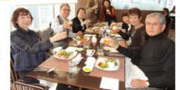
シニアユニバーシティ大学院東浦和校 卒業式